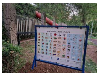
Slika 9 Senzorni park Centra za autizam Rijeka 29.09.2023.