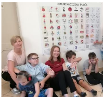
Slika 6 Centar za autizam Rijeka 29.09.2023.