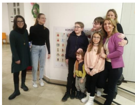
Slika 11 Postavljanje komunikacijske ploče u GKL Rijeka