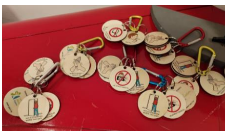
Slika 13 Pravila ponašanja za posjetitelje Kazališta na privjescima