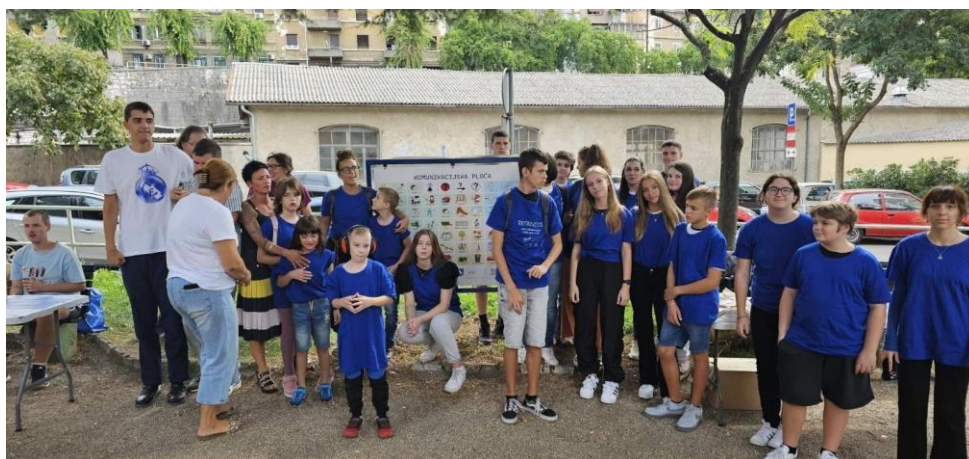
Slika 5 Dječje igralište „J. Završnika“ Potok 15.09.2023.