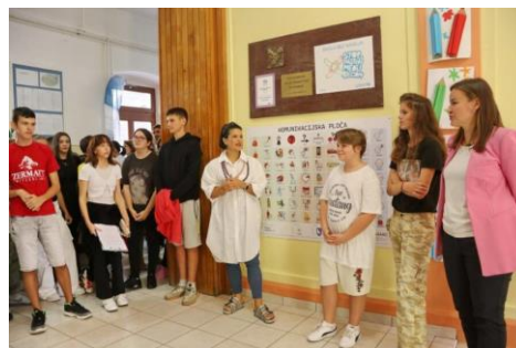
Slika 7 Osnovna škola Centar 27.09.2023.