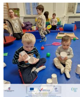
Slika 14 Radionice Rekreativnih vježbi