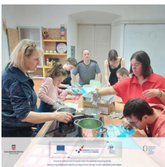
Slika 18 Radionice izrade sapuna