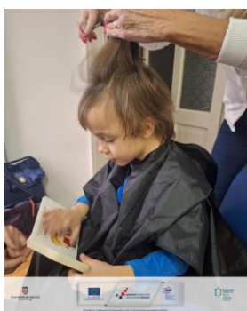
Slika 16 Frizerske radionice