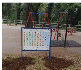
Slika 8 Dječje igralište Giordano Bruno 13.10.2023.