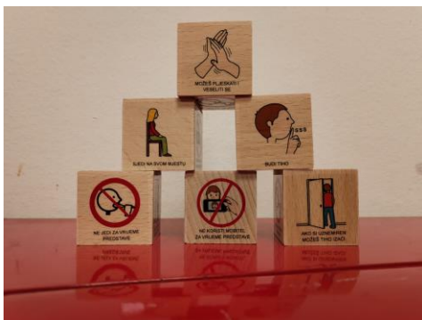
Slika 10 Pravila ponašanja za posjetitelje Kazališta na kockicama

rehabilitacijskih postupaka, težili smo podizanju razine djetetovih komunikacijskih i svakodnevnih vještina. Promovirali smo korištenje komunikacijskih alata za potpomognutu komunikaciju i njihovu integraciju u javne prostore kako bi sva djeca s poremećajima jezika i govora imala jednak pristup kulturno-umjetničkim sadržajima. Organizirali smo zajedničke aktivnosti djece urednog razvoja s djecom s autizmom u Gradskom kazalištu lutaka, s ciljem izgradnje inkluzivnijeg društva i poticanja razumijevanja specifičnosti djece s autizmom među vršnjacima i njihovim obiteljima. Postavljanje komunikacijske ploče za djecu s komunikacijskim i jezično-govornim teškoćama u atriju Gradskog kazališta lutaka Rijeka predstavlja važan korak prema inkluzivnom programu rane intervencije za djecu iz spektra autizma. Ova inicijativa naglašava predanost socijalnoj osjetljivosti Gradskog kazališta lutaka, koje je postalo prva kulturno-umjetnička ustanova u Rijeci koja prepoznaje važnost inkluzivnih programa. Komunikacijska ploča, uz prateću društvenu priču dostupnu putem QR koda, nije samo sredstvo olakšavanja komunikacije za djecu s teškoćama, već i koristan alat za sve posjetitelje, podsjećajući ih na pravila ponašanja u kulturnim ustanovama. Kroz implementaciju komunikacijskih alata u javne prostore i organizaciju zajedničkih aktivnosti djece tipičnog razvoja s djecom iz spektra autizma, potiče se integracija i podizanje razine komunikacijskih i svakodnevnih vještina djece.