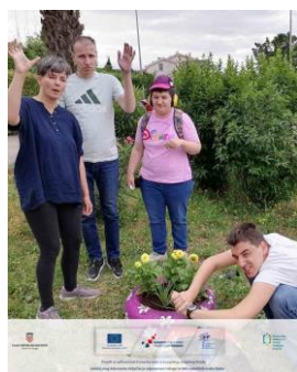
Slika 17 Radionice izrade ukrasnih vaza za cvijeće