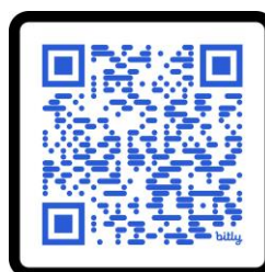
Slika 12 QR kod za preuzimanje komunikacijske priče: "Ja u kazalištu"