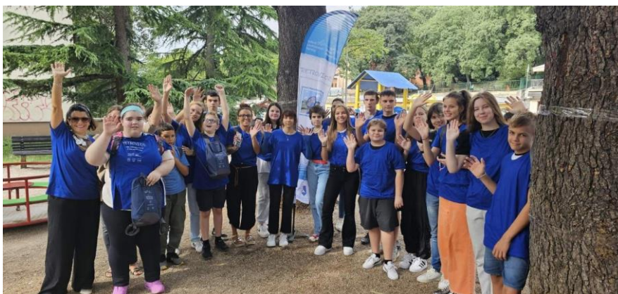
Slika 2: Postavljanje prve komunikacijske ploče za potpomognutu komunikaciju u gradu Rijeci – Dječje igralište „Potok“ 15.9.2023.

Ove smo godine obilježavanje Svjetskog dana autizma proveli tradicionalno na gradskom Korzu, gdje smo uz djecu i osobe iz autističnog spektra, članove obitelji, građane, predstavnike drugih organizacije te predstavnike područne i regionalne samouprave organizirali puštanje plavih balona točno u 12:00 h, a Grad Rijeka je na naš zahtjev 2.4.2023. godine, osvijetlio plavim svjetlima dio znamenitosti Grada i time se priključio svjetskim metropolama koje na ovaj način iskazuju potporu osobama s autizmom.