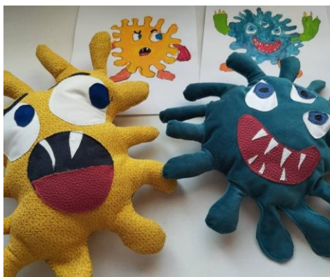
Slika 4 Kreacije djece oživljene kroz kreativne radionice Udruge